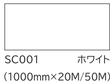
SC001 ホワイト (1000mm×20M/50M)