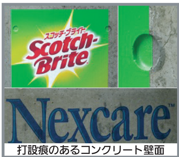
打設痕のあるコンクリート壁面

※この製品には施工時の位置決めをサポートするための透明アプリケーションテープが付いています。剥がし忘れの無いようご注意ください。