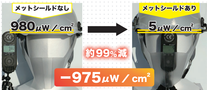
※ 2020年6月下旬16時ごろ 気温30.3℃ ※ 試験結果は当社試験による