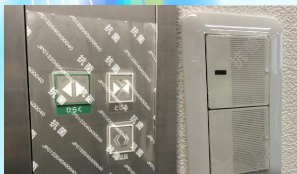
エレベーターボタン・スイッチ類