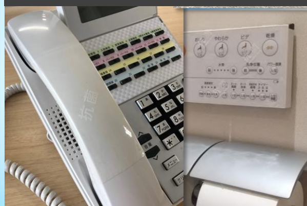
受話器・様々な器具類