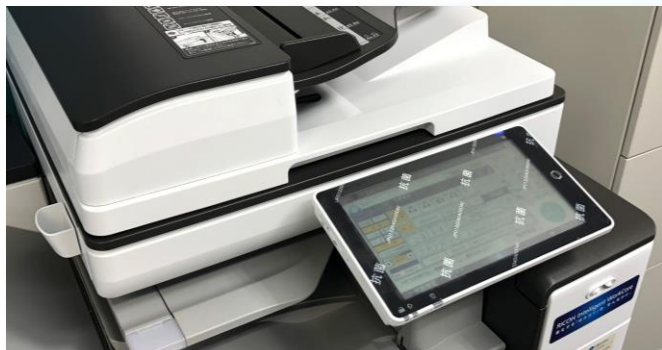
様々なタッチパネル類