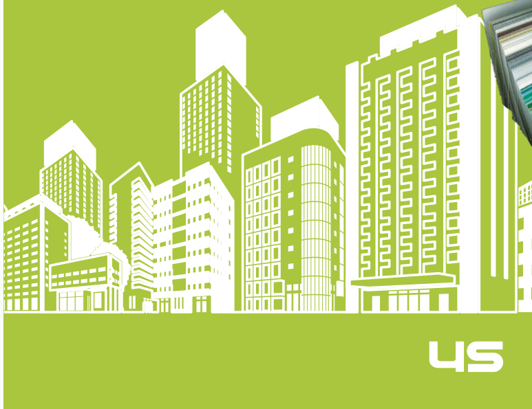
グラフィックフィルムシリーズカタログ