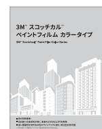
ペイントフィルム