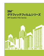
グラフィックフィルム